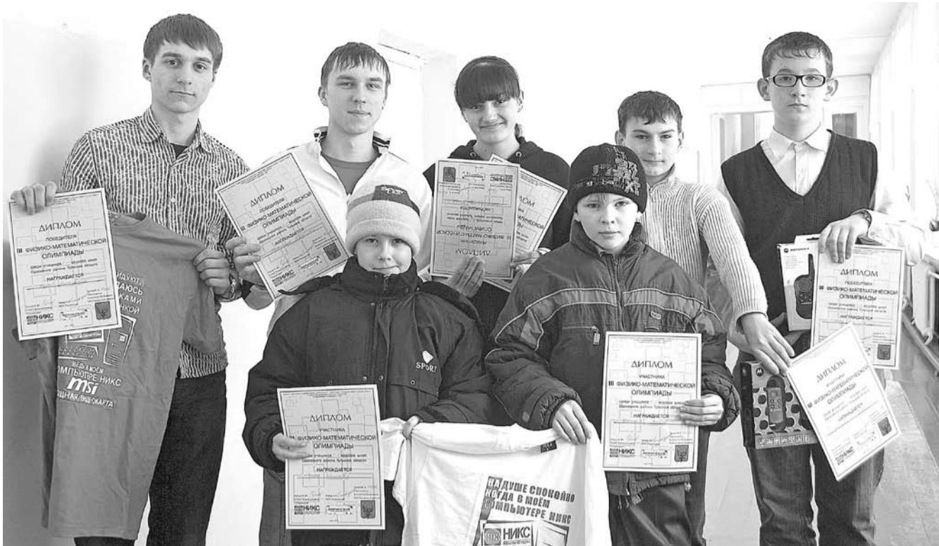
Физико-математическая олимпиада, организаторами которой являются ООО «АПК «Тюринский» при поддержке компьютерного супермаркета «Никс» и Московского центра непрерывного математического образования, 12 марта прошла в Одоеве уже в третий раз.